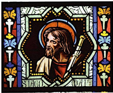
Vitrail de Belley : Saint-Jacques le Majeur