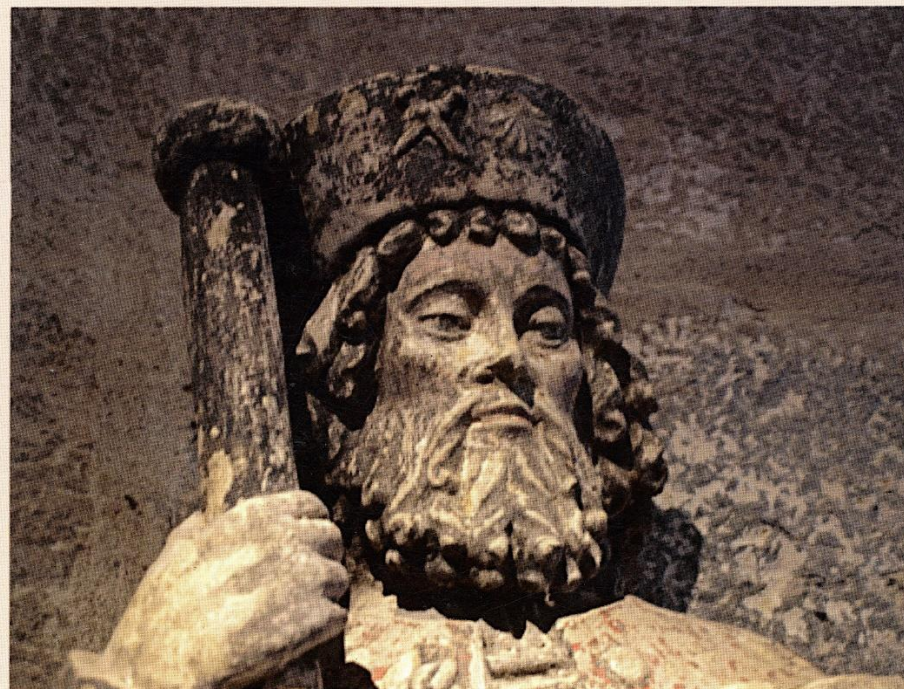
Saint-Jacques le Majeur, église Saint-Irénée de Chatillon-la-Palud

Association Rhône-Alpes des Amis de Saint-Jacques Jf Wadier