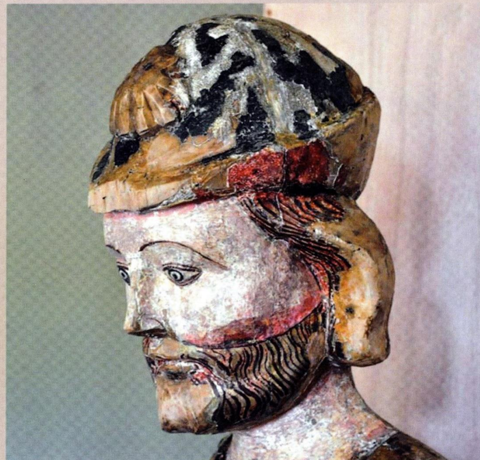
"Saint Jacques pèlerin de Compostelle" Saint-Jacques de Thénésol (XV ème s.) – Musée de Conflans-Albertville

" Le rêveur éveillé, ou la profondeur intérieure... "